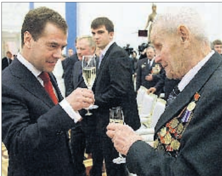
«NASTROVJE!» Medwedew stösst mit einem Veteranen an.