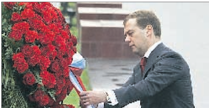
GEDENKEN Medwedew am Grab des Unbekannten Soldaten.